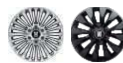
Легкосплавные диски 19"